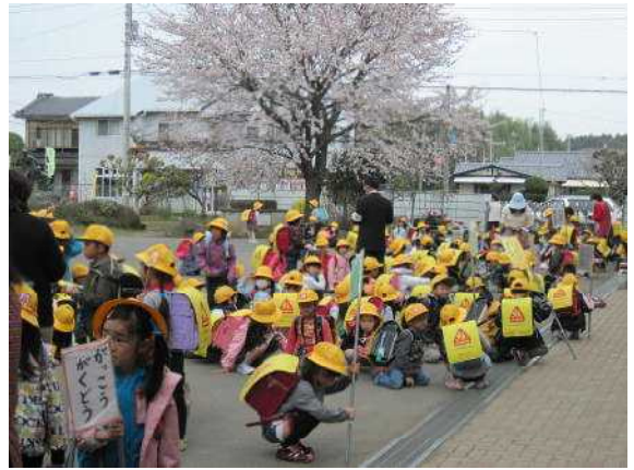
<方面別に並んで下校するピカピカの1年生>